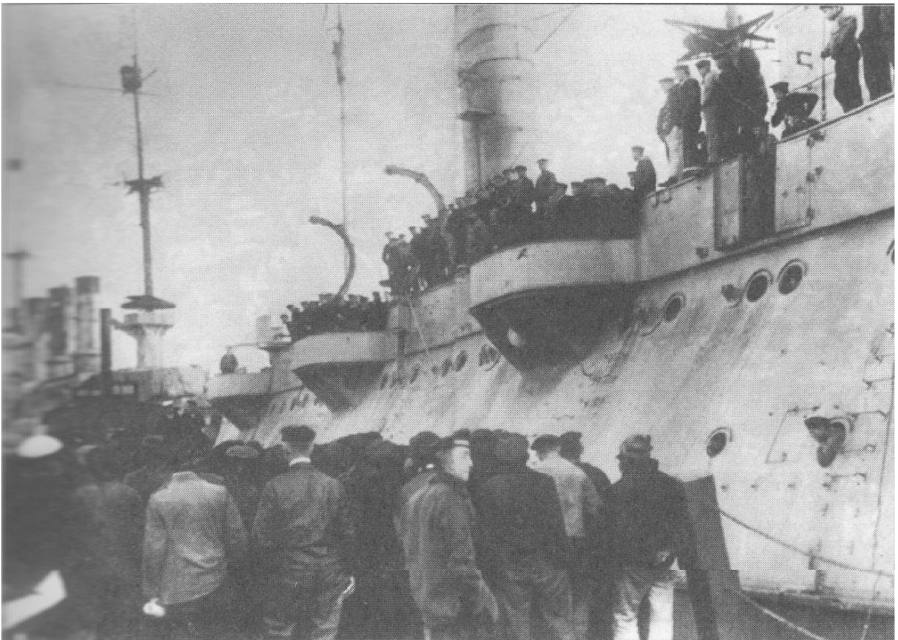
(Εξέγερση στο ναύσταθμο του Κιέλου, Οκτώβρης 1918. Η εκκίνηση ενός μακρού πολέμου για την επανάσταση)

«Ένα πρωί θ'ανοίξω την πόρτα Μες την απέραντη μοναξιά»